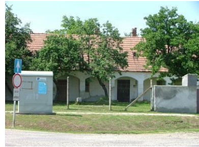
Vajda P. u. 4. hrsz.: 77/3.