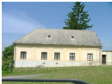
Kossuth L. u. 10. hrsz.: 179