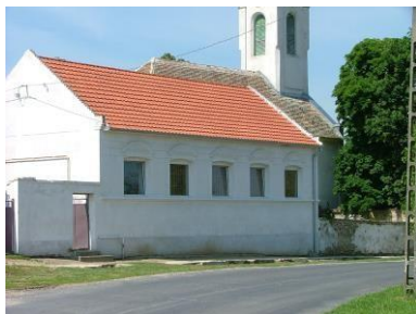
Vajda P. u. 4. hrsz.: 77/3.