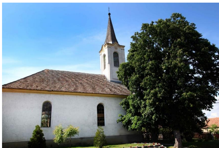
Vadgesztenyefa az evangélikus templom mellett