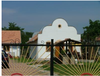
Petőfi u. 23. hrsz.: 303.