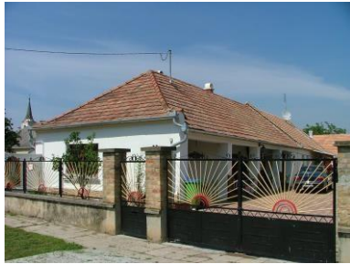
Petőfi u. 23. hrsz.: 303.

hossziránya megegyezik az utcával, széles frontjukkal fordulnak kifelé, a járdáig nyúlóan, de rövid oldalukkal nem érintkeznek.