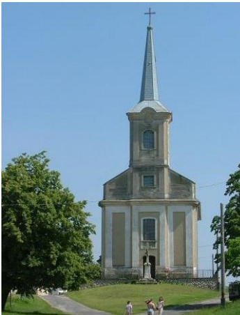
Kossuth L. u. hrsz.: 272.

A római katolikus templom 1737-ben épült barokk stílusban, kétboltszakaszos hajóval, homlokzati toronnyal, és félköríves záródású szentéllyel. Bűnbánó Magdolna tiszteletére szentelték. Később többször átalakították. Egy ideig a protestánsoké volt, de Padányi Bíró Márton visszavette, és megnagyobbította. 1885-ben eklektikus stílusban építették át. Tornya a főhomlokzatból kissé kiemelkedik, homlokzatát falsávok tagolják. Bejárata felett kissé szegmensívű, szalagkeretes ablak. Homlokzatát egy erős kiülésű párkányzat, és a harangtorony alatti vakolatpárkány három részre osztja. Középső mezőjében egy négyszögletes formájú, szalagkeretes, szalugáteres ablak. A harangtorony oldalain szegmensívű, szalagkeretes, szalugáteres ablakok. A toronysisak alatti vakolatpárkány félkör ívben követi az óra helyének vonalát. Toronysisakja gúla alakú, palaborítású, tetején latin kereszt. A templom alacsony dombon épült, terméskő talapzatra támaszkodó vaskerítés veszi körül. Előtte fészület Korpusszal.