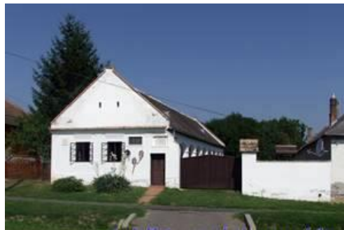
Vajda P. u. 44. hrsz.: 38/1.