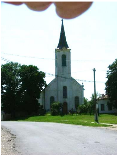
Vajda P. u. 4. hrsz.:77/3