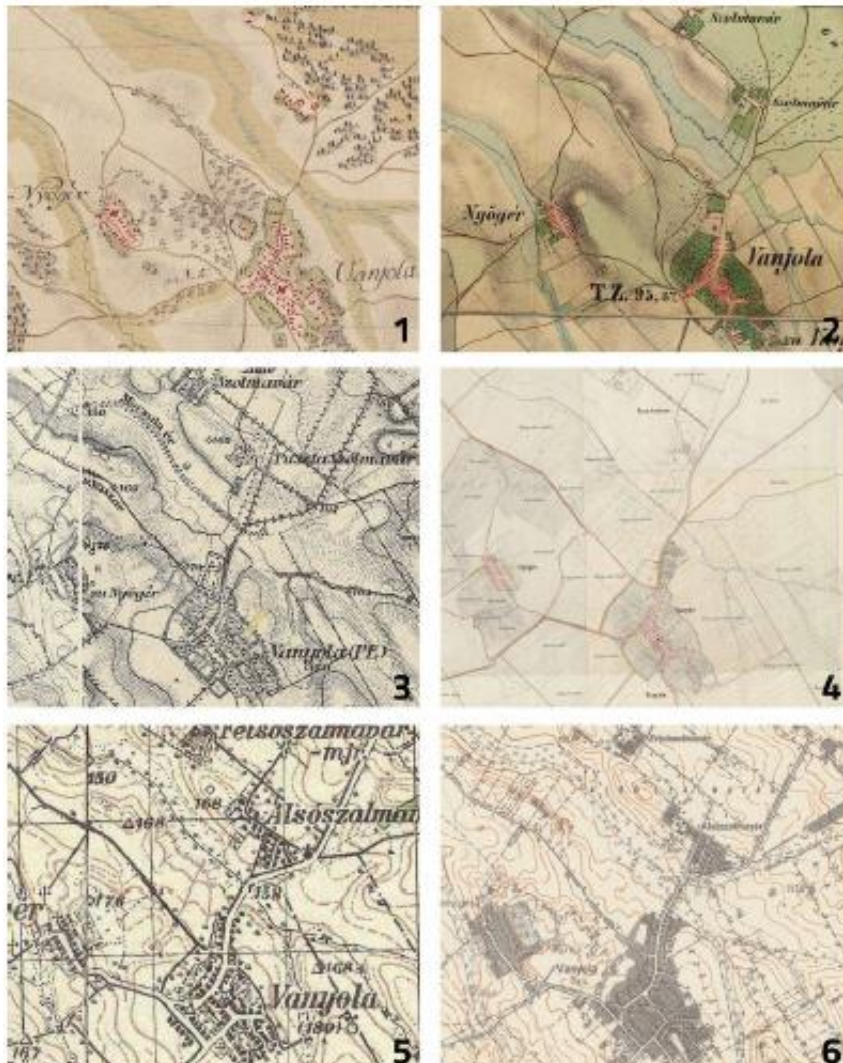
1. Első Katonai Felmérés (1763-1787); 2. Második Katonai Felmérés (1806-1869); 3. Harmadik Katonai felmérés (1869-1887); 4. 19. századi kataszteri térkép (1857); 5. Katonai Felmérés (1941); 6. Topográfiai térkép (1971)

Egyházas hely volt, 1475-ben egy oklevél plébánosának nevét említi.)